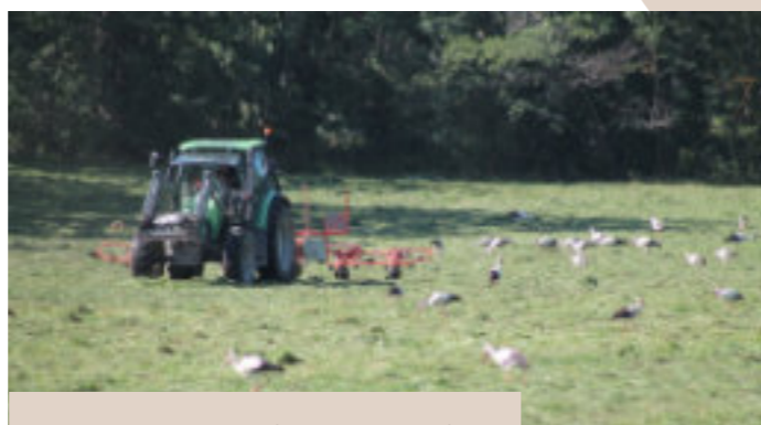
En septembre, les cigognes ont fait une longue halte dans les champs derrière le collège de Bourg-Madame.

Ainsi, les grands deltas tels que la Camargue et les marais audois sont très prisés par les grands échassiers comme la cigogne. La plaine de Cerdagne avec son climat doux et son paysage bocager permet d'accueillir ces types d'oiseaux. En effet, les pluies estivales, le maillage de cours d'eau abondant ainsi que les cultures vivrières offrent une richesse alimentaire pour ces grands voyageurs.