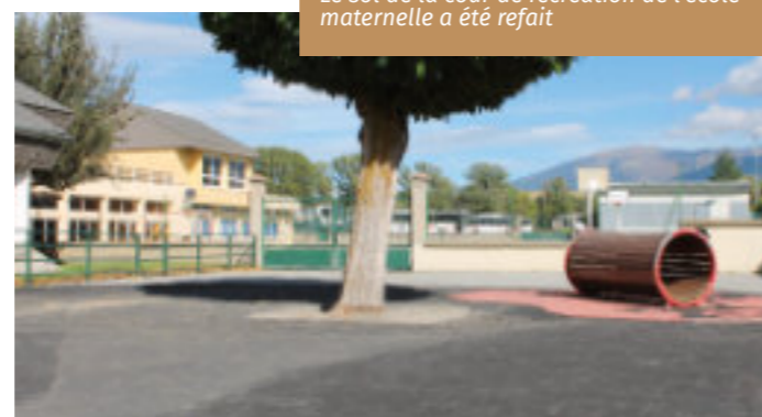
Le sol de la cour de récréation de l'école maternelle a été refait

De plus, un nouveau surveillant rejoint l'équipe, assurant une présence accrue pour veiller au bon déroulement de la vie scolaire. Autre nouveauté notable : l'infirmier a été totalement rénové, offrant un cadre moderne et mieux équipé pour répondre aux besoins des élèves.