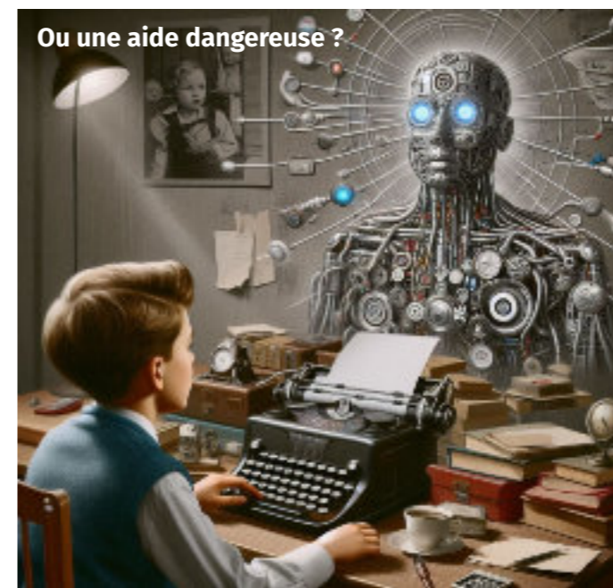
Ou une aide dangereuse ?

Aujourd'hui l'intelligence artificielle traiterait le sujet en trois minutes. Elle aurait même traduit en deux minutes de plus le poème en anglais ou en chinois. Quelle aubaine pour les paresseux, que l'intelligence artificielle qui encourage votre passivité et vous dérobe une occasion d'exercer les muscles de votre intelligence, de faire preuve de vos talents d'être humain.