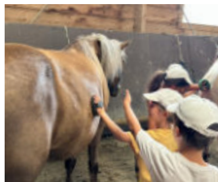
Equitation avec le centre de loisirs