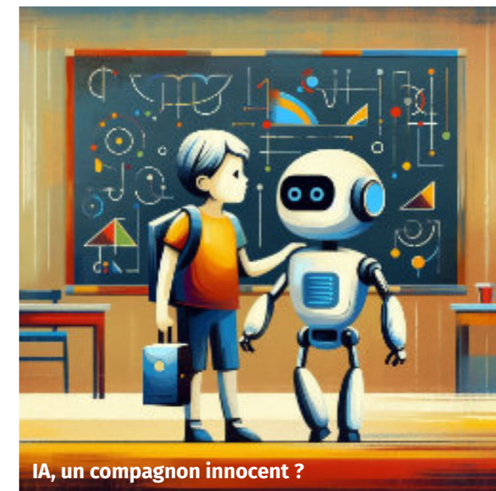
IA, un compagnon innocent ?

Car la bataille avec les machines, qui nous ôtent à nous-mêmes, est bien engagée. D'un côté robotique, super ordinateurs, de l'autre l'être humain avec ses trous de mémoire, ses émotions, ses faiblesses mais aussi son originalité, sa spécificité d'être humain c'est-à-dire le contraire d'une machine froide, méthodique qui vous empêchera d'être vous-mêmes et prendra votre place avec la complicité de votre paresse.