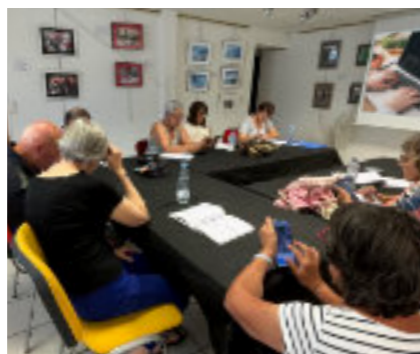
Ateliers numériques du Mercredi